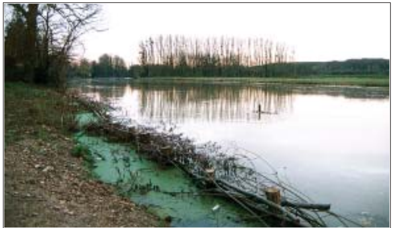
Technique du fascinage.

En 1992, dans le cadre de sa politique de préservation des espaces naturels sensibles, le Conseil Général de Seine-et-Marne a créé un périmètre de préemption, en collaboration, avec la commune de Souppes-sur-Loing, sur des zones humides ou situées à proximité immédiate du Loing. En 1997, la Direction de l'Eau et de l'Environnement du Conseil Général a fait réaliser une étude sur l'aménagement et la gestion de ces espaces. Celle-ci a permis d'identifier les Espaces Naturels Sensibles (ENS) de la commune de Souppes-sur-Loing. Les sept secteurs retenus consistaient en des zones humides ou situées à proximité immédiate du Loing. Après consultation des intéressés, il est apparu que le Conseil Général, la municipalité de Souppes sur Loing et Souppes Base de loisirs avaient des intérêts communs pour l'aménagement de certains espaces humides sensibles. C'est avec