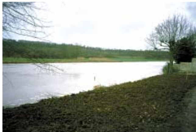
Les bords du Loing, avant et après réhabilitation.