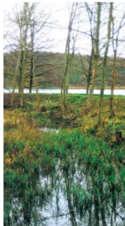
Réhabilitation d'aulnaie : un exemple de valorisation paysagère.

Le CFPPA de Brie-Comte-Robert met en œuvre des formations qualifiantes ou de perfectionnement à destination des acteurs de l'agriculture et de l'environnement.